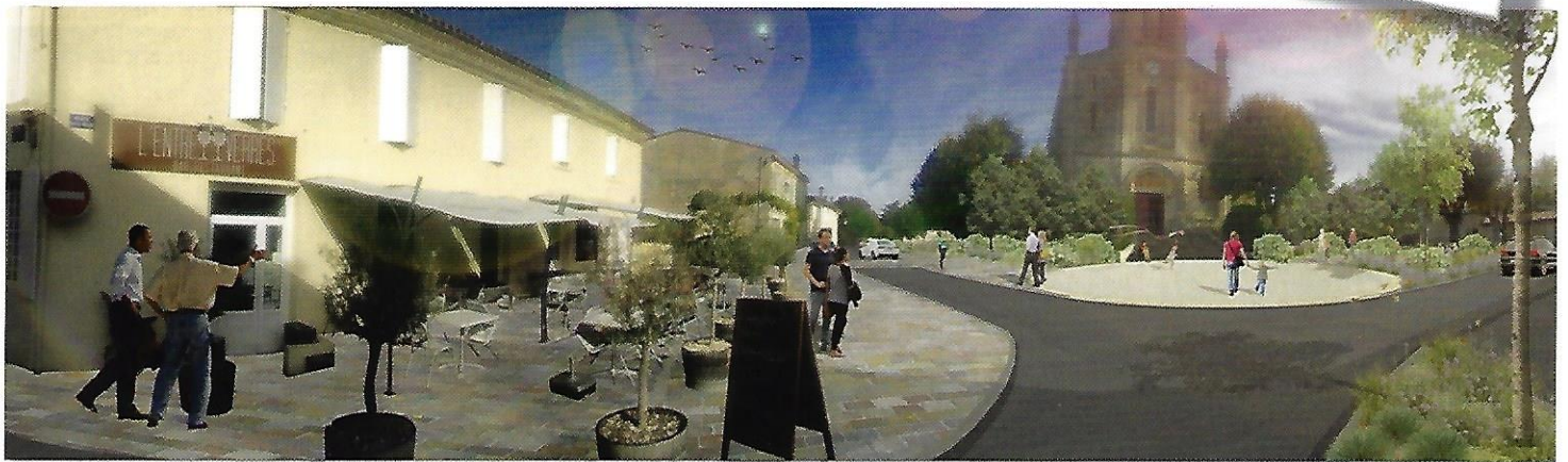
Photos montage sur le projet d'aménagement du bourg